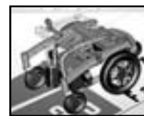
Olivier Boschung a réduit les coûts d'un fauteuil roulant. ALAIN WICHT